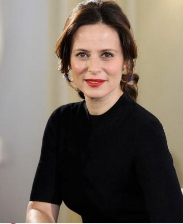
Aitana Sánchez Gijón